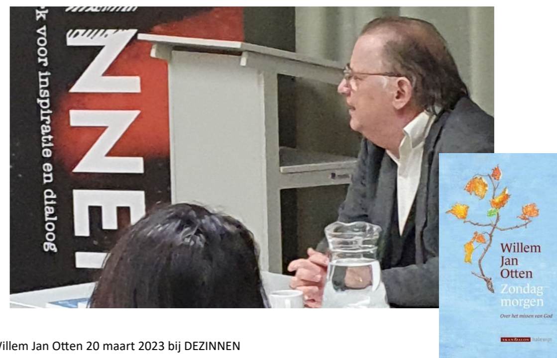
Lezing Willem Jan Otten 20 maart 2023 bij DEZINNEN

DEZINNEN is een open netwerk en brengt dat ook tot uitdrukking door met een verscheidenheid aan partners samen te werken. Daarbij moet één partner in het bijzonder worden genoemd; de Christus Triumfatorkerk. Het bestuur van DEZINNEN is de gemeenschap van de Christus Triumfatorkerk bijzonder erkentelijk voor de getoonde gastvrijheid en het vertrouwen.