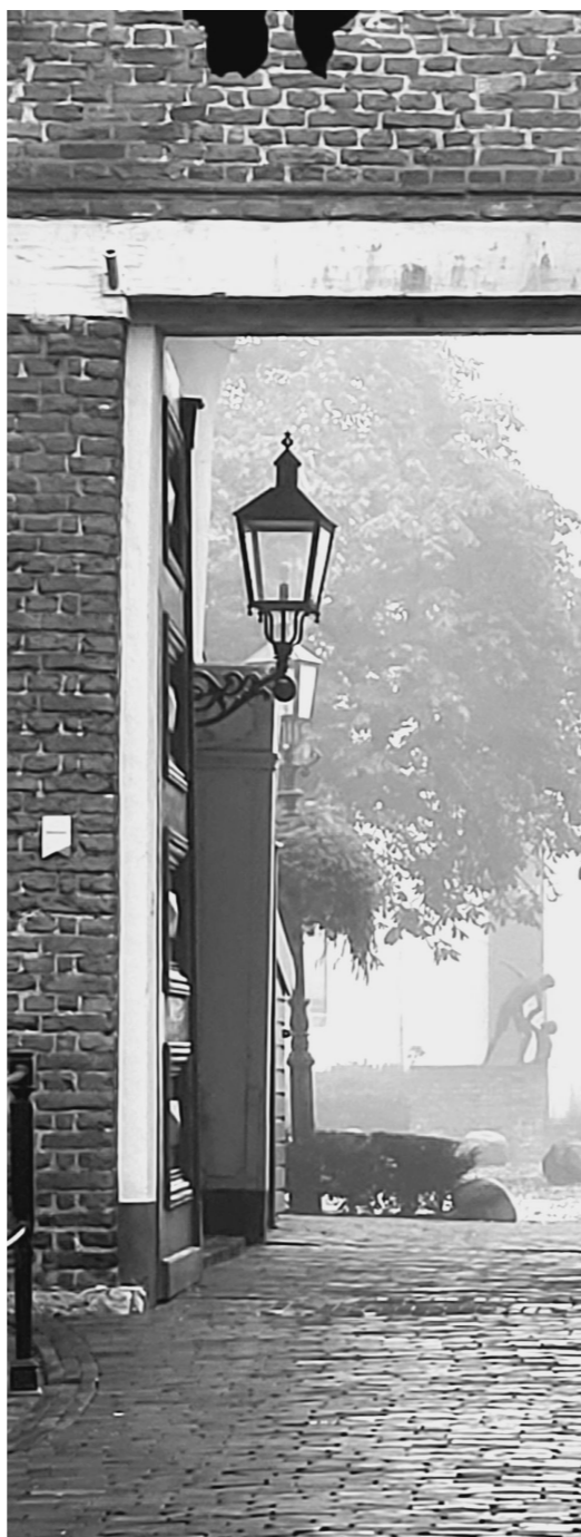
Poorthuis voormalig kasteel Montfoort